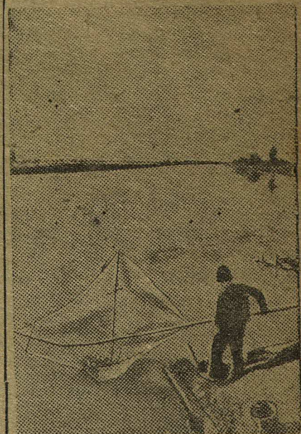
НА СНИМКЕ: река Прут, по которой проходит граница между Советским Союзом и Румынией.

лаврах. До сего времени в колхозе не очищено ни одного килограмма семян. Руководители Мирненской МТС не раз советовали тов. Зинковскому начать обмен рядового зерна на чистосортное, даже договорились об этом с другими колхозами. Однако упрямый председатель не хочет слушать хорошие советы, он забывает, что весна не будет ждать и она спросит, что зимой делали, почему не подготовили семена заблаговременно. Колхозник.